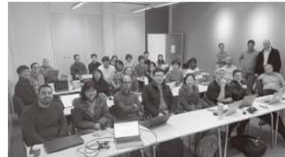
カロリンスカ研究所での研修 2020年

大きさを感じ取ったのです。今思うと、日本文化には隠れがちの、アメリカならではの違いを認め多様性を大切にするという側面に触れて感動したのです。