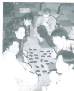
ディスカッションの後、共にゲームを楽しむジュニア大使と英国の青少年たち

短い時間内のイギリス人との交流。たったの2泊3日だけなのに、その間にあった一つ一つの出来事はとても充実しており、またたくさんの事を学べたような気がします。言いたいことが思うように英語に訳せなくて話がはずまず、自分を情けなく思う時もありました。反対に、相手の冗談と一緒に笑えた時などは本当に嬉しかったです。英語がペラペラとは話せない私にとって、言葉よりも顔の表情が相手を知る貴重なもの