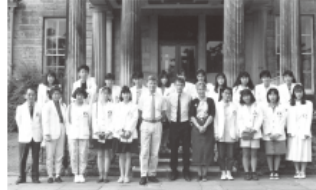
シェフィールド大学にて 前右から3番目

イギリスではシェフィールド大学の寮で生活し、キャンパスの広大さや伝統を感じさせる趣きのある建物、またベッドなどのリネンに使われている可愛いファブリック(布)など、新鮮な驚きを心がぐんぐんと吸収していききました。大きな発見といえば、自分自身がアジア人であり日本人であるということでした。日本を自分の国として見つめ直し、同時に、いかに自分の国を知らないか気づく機会となりました。