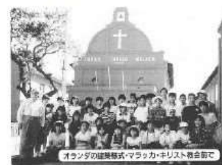
オランダの建築様式・マラッカ・キリスト教会前で

なものになるかもしれないと考えます。日本に来てよかったと思ってもらえるよう、工夫して授業をすることが今の私の目標です。