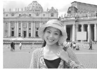
ローマ、バチカンの美術館の前で

も多種多様ですが、大切なことは相手を理解しようとする心で、それは相手にちゃんと伝わるものと実感しました。