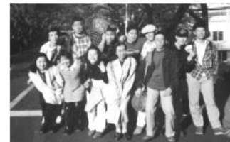
参加6年後のジュニア大使同窓会 於：国立オリンピック記念青少年総合センター 後列左から2番目

異文化間での「慮り」はそれぞれが異なる価値観に依拠して慮るわけですから等しい結論を導くとは限りません。また誤謬(ごびょう)が発生する可能性もあります。そうすると必要となるのが軌道修正をするための意思伝達手段としての言語であろうと思います。