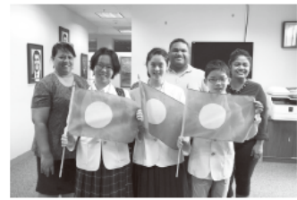
2019年パラオ政府訪問、前列向かって右

僕は海外には毎年親と一緒に行っていましたが家族と離れホテルの部屋に一人で泊まるのははじめてでした。僕の親はその為とても心配していました。しかし、僕自身はパラオがどんな国なのかワクワク感が強く親にはとても申し訳ないのですが飛行機に乗る時には寂しさは全くなかったです。一晩