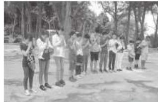
戦火の跡の前で皆でご冥福を祈る

また、この英語のみで生活をするという経験が、自分の英語力が身につくことにもつながっていると思います。